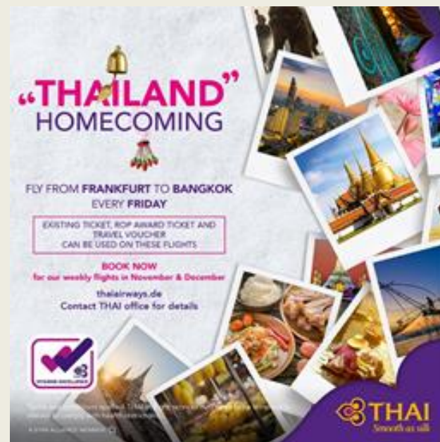
schéma speciálních turistických víz (STV) pro dlouhodobě pobývajících návštěvníky. Ta jsou však nyní vydávána zatím v zemích s nízkou mírou infekce COVID-19, řídící se předpisy thajského ministerstva veřejného zdraví.

V tuto chvíli (říjen 2020) není turistům do Thajska dosud vstup povolen v plné míře. Thajsko však umožňuje zvláštním skupinám turistů, kteří nejsou thajské národnosti, žádat o víza pro vstup do země. Patří sem některá non-imigrant víza typů B a O-A a držitelé Elitní karty. K dispozici je také